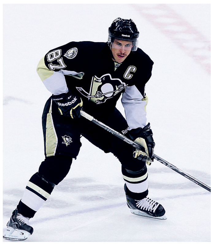
HVĚZDA. Sidney Crosby.

ruského kanonýra Alexandra Ovečkina z Washingtonu. U fanoušků ale příliš nezabodovali ani čeští hokejisté.